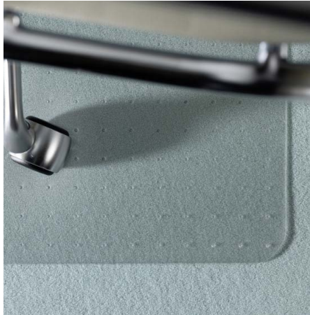
Für Teppichböden mit Ankernoppen