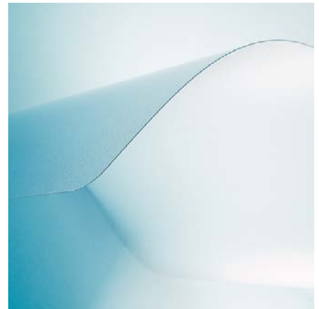
Für Hartböden mit VAB®-Haftschrift